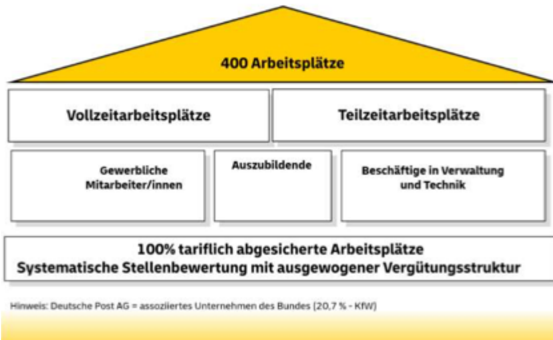
Abbildung 3, Auszug aus dem Flyer Logistikstandort Weichering